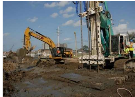
Sol (Investigation et assainissement)