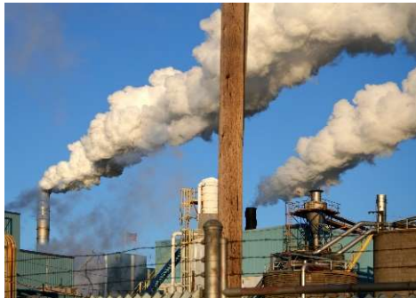
Environnement (EIE, ISO, etc.)