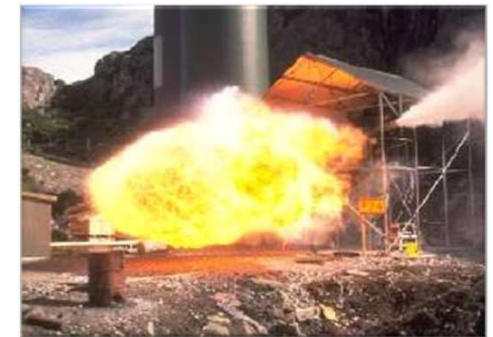
Sécurité (SEVESO, risques, etc.)